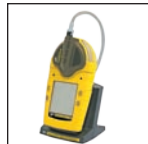
连体泵和电池充电器