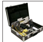
受限空间工具套装